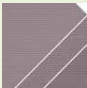
503 – BRUN NOISETTE