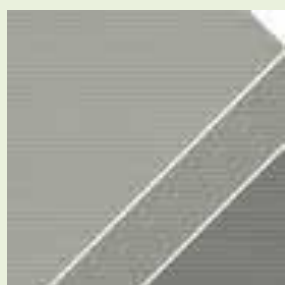
509 – GRIS GALET